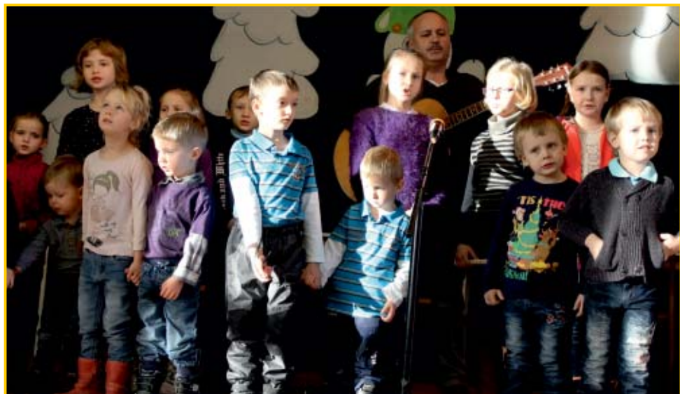
vystoupení dětí základní školy a Dětské skupiny Sluníčko